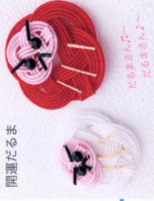
だるまさん♪ だるまさん♪